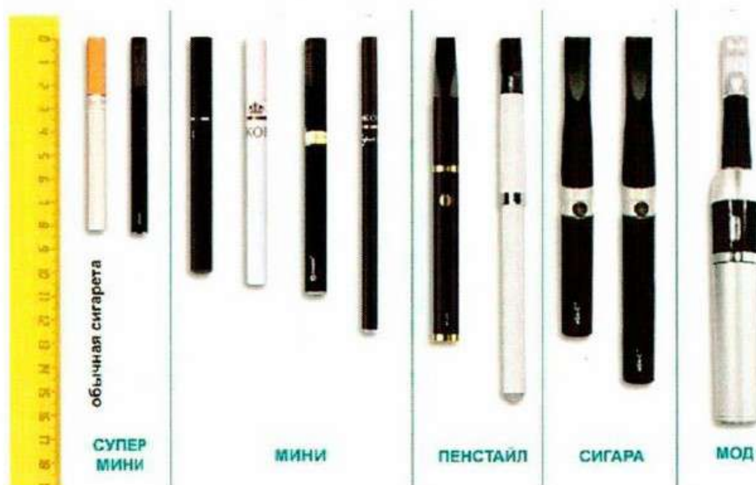
Рис.4. Типы и размеры электронных сигарет

Электронные сигареты (вейпы) классифицируются также по типу и размеру (рис.4) в соответствии с длиной (от 82 мм до 175 мм).