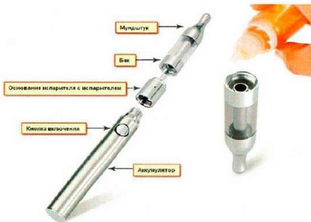
Рис. 3. Устройство электронной сигареты

Обычная электронная сигарета состоит из аккумулятора, электрического испарителя, емкости для жидкости, мундштука и дополнительных элементов для автоматического управления подачей ароматизированной жидкости (но последние имеются не во всех моделях), рис.3.