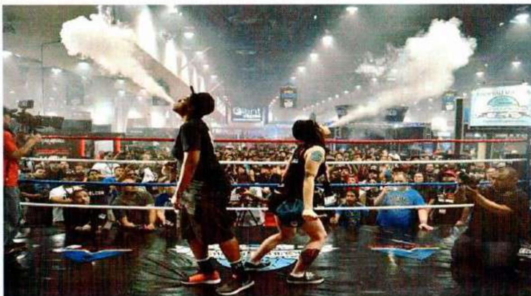
Рис. 2. Вейпинг соревнование

В Москве в 2019 году была проведена девятая по счету выставка VapeExpo.