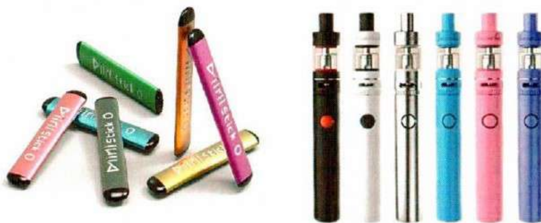
Рис. 5. Одноразовые (слева) и многообразные (справа) электронные сигареты

Одноразовые ЭС рассчитаны на 200 - 500 затяжек пара. В многообразных устройствах нет таких ограничений и они работают до тех пор, пока доливается жидкость в емкость.